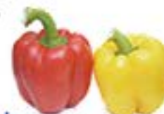
宮崎県 大分県 パプリカ