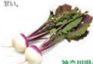
神奈川県 あやめ雪かぶ