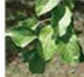
明るい葉の色(葉肥た)