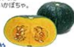
静岡県 鹿児島県 かぼちゃ