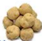
北海道 ちびじゃが