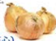
北海道 玉ねぎ(天心)