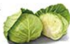
愛知県 あまだまキャベツ

冬に旬を迎えるキャベツは、総じて甘いのですが、硬いものが多いです。こちらは、やわらかく、あまく、ジューシーです。