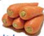
青森県 雪の下にんじん