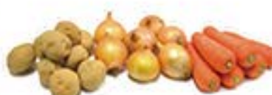
じゃがたま人参セット