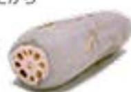
佐賀県 佐賀れんこん