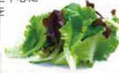
大分県 ベビーレタスマックス