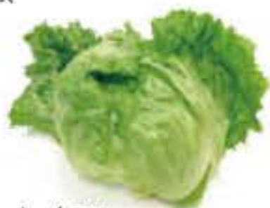
山梨県 /静岡県 レタス