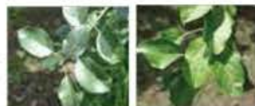
↑肥料が多いと葉の色が濃い(左写真)

りんごの力を引き出そうと、肥料をほとんど与えません。葉の色を見比べると一目瞭然。植物自らが強くなろうと根を深く土に伸ばします。甘く、蜜たっぷりのふじりんごをどうぞ。