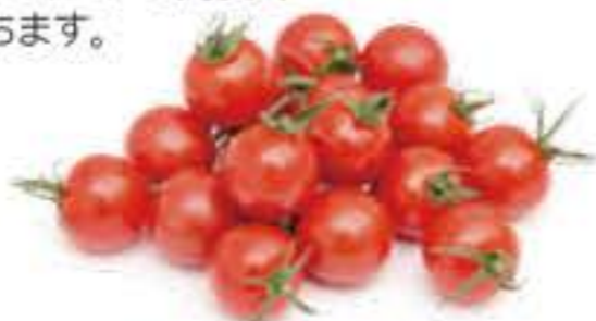
愛知県 ミニトマト