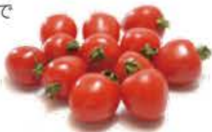
大分県 いちごトマト