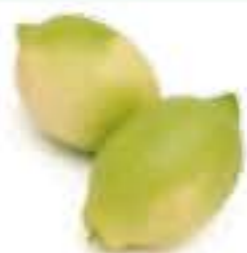
熊本県 ハウスレモン