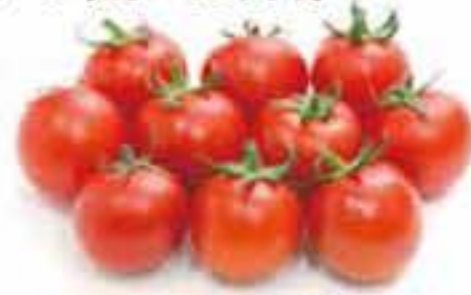
宮崎県/岐阜県 ミディトマト