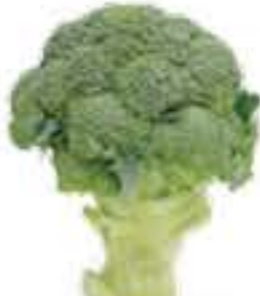
静岡県 ブロッコリー