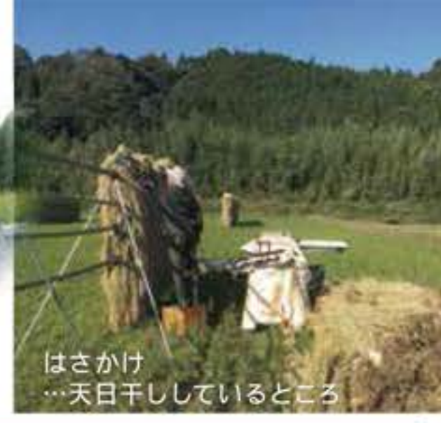
はさかけ...天日干しているところ

年末年始に欠かせず、それでいて、何にでもご利用いただける、生産者限定の11の野菜をとりそろえました。市場がお休みに入る前の野菜が高騰する時期ですので、便利かつお得なセット。