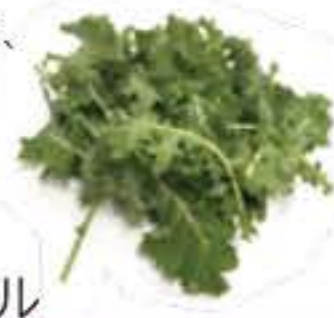
大分県 ベビーケール