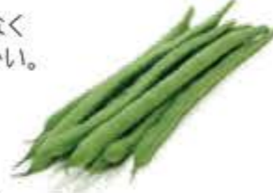
長崎県 /沖縄県 インゲン