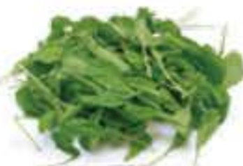
大分県 ルーコラ(カット済み)