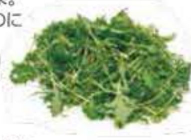
大分県 サラダ水菜