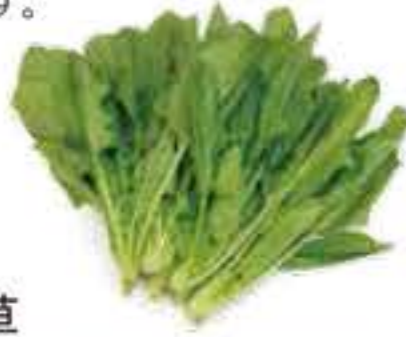
静岡県 ほうれん草