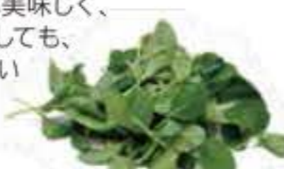
大分県 サラダ小松菜