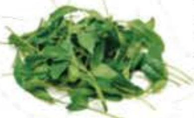
大分県 サラダほうれん草