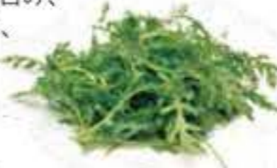
大分県 サラダ春菊