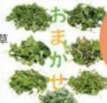
大分県 おまかせリーフ3点セット