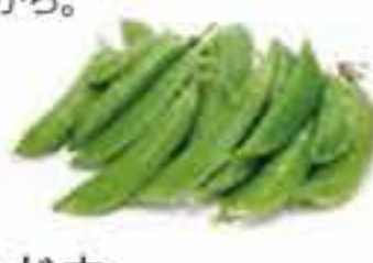
鹿児島県 スナップエンドウ