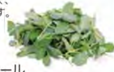
大分県 ベビーケール