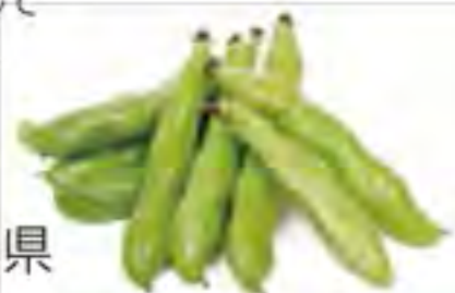
鹿児島県 ソラマメ