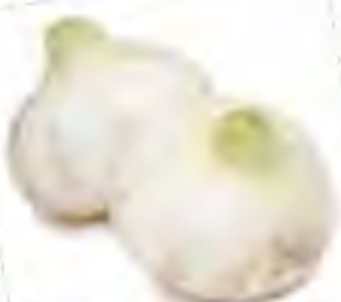
静岡県 サラダオニオン