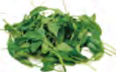
大分県 サラダほうれん草