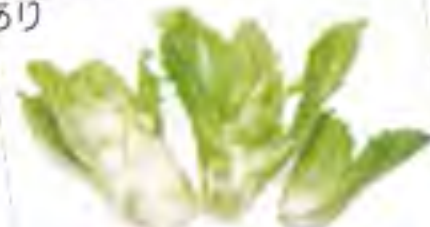
静岡県 つぼみな 蕾菜