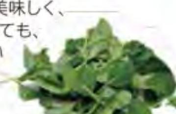
大分県 サラダ小松菜