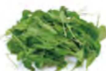
大分県 ルーコラ (カット済み)