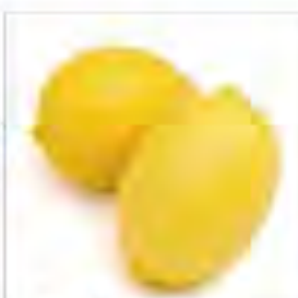
熊本県 ハウスレモン