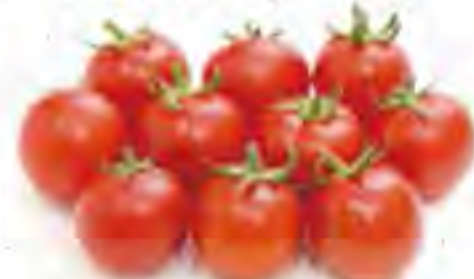
宮崎県/岐阜県 ミディトマト