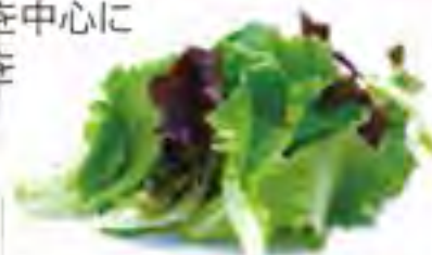
大分県 ベビーレタスマックス