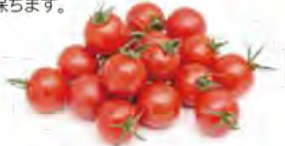
愛知県 ミニトマト