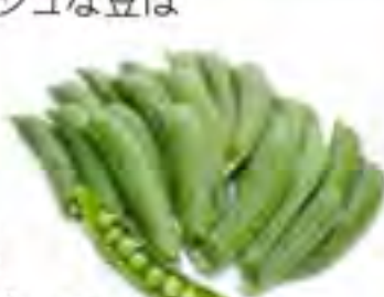
鹿児島県 グリーンピース