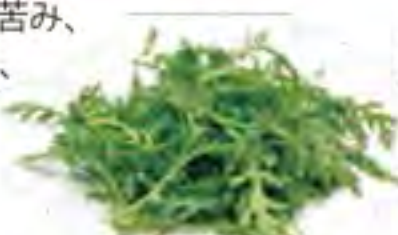
大分県 サラダ春菊