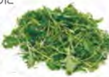
大分県 サラダ水菜