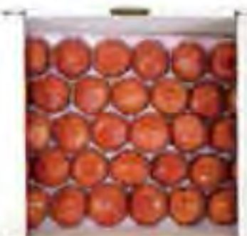
Large = 約2.6kg

"フルーツトマト"ってよく言われますよね。でも、その考え方があるのは、世界中で、日本だけ、なんです。