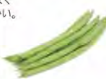
沖縄県 長崎県 インゲン