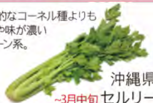
沖縄県 ~3月中旬 セルリー