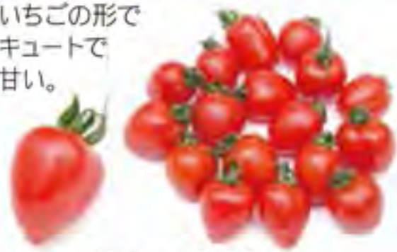
大分県 いちごトマト