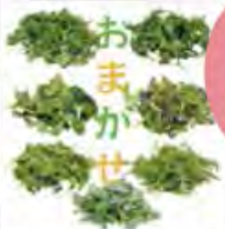
大分県 おまかせリーフ3点セット