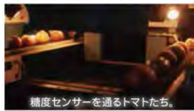
精度センサーを通るトマトたち。