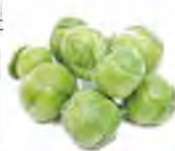
静岡県 芽キャベツ