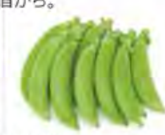
鹿児島県 スナップエンドウ